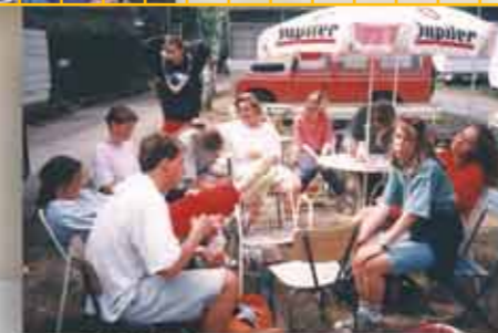
Doodmoe op de camping bij 'De Dikke'.