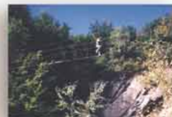
De "Dirty Harry" bridge.