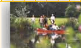
Havo 3. Wat een idylle.

Het programma werd vanaf 1997 gecompliceerd met een hike rond de Dommel: de Dommeldal Expeditie. Speciaal voor havo 3 leerlingen stelde ik een tocht samen van 12 km. waarin wandelen en samenwerken centraal stonden. Bij de start lag het eerste probleem al klaar. Materialen zoals palen, touwen, een ton, binnenbanden van auto's en een brandcard moesten de hele dag door de groep meegesjouwd worden. Wie pakt wat? Niemand reageert fanatiek, dus de mentor geeft het goede voorbeeld. Zo zat de dag vol met verschillende opdrachten waarbij de twee oversteken over de Dommel wel het meest opvallend waren. In de eerste jaren moest nog met behulp van de meegenomen materialen een vlot gebouwd worden. Banden werden met de mond opgeblazen en iedereen kwam door de Dommelseop aan de overkant. Echte survivors. Tegenwoordig ligt er een canadese kano klaar. Oorzaak: spontane zwempartijen in de Dommel met als gevolg veel zieke leerlingen. En dat krijg je natuurlijk niet verkocht aan de ouders. De tocht was vooral voor de mentor van grote waarde. In een dag tijd waren alle karakters van de klas in kaart gebracht. De haantje de voorsten, de drukkers, de meelopers, de altijd behulpzamen en ga zo maar door. Als beloning werd de Dommeldal Expeditie altijd met een barbecue op school afgesloten. Een traditie die nog steeds wordt voortgezet. Het Eckart is meer dan een leeravontuur binnen 4 muren.....!!! Nevenstaande foto's spreken voor zich.