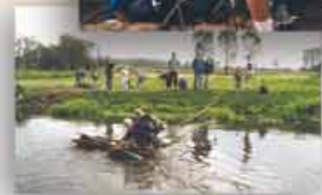
De klas van dhr. Schellekens steekt de Dommel over op een zelfgemaakt vlot.