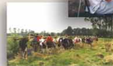
Langs de Dommel, Havo 3 1997.

zitten en duizend doden te sterven was niet echt prettig. Maar eenmaal buiten voelde iedereen zich een bikkel. Dat je regenpak daarna onbruikbaar was door de pigment in de klei deerde verder niet. Je dag kon niet meer stuk.