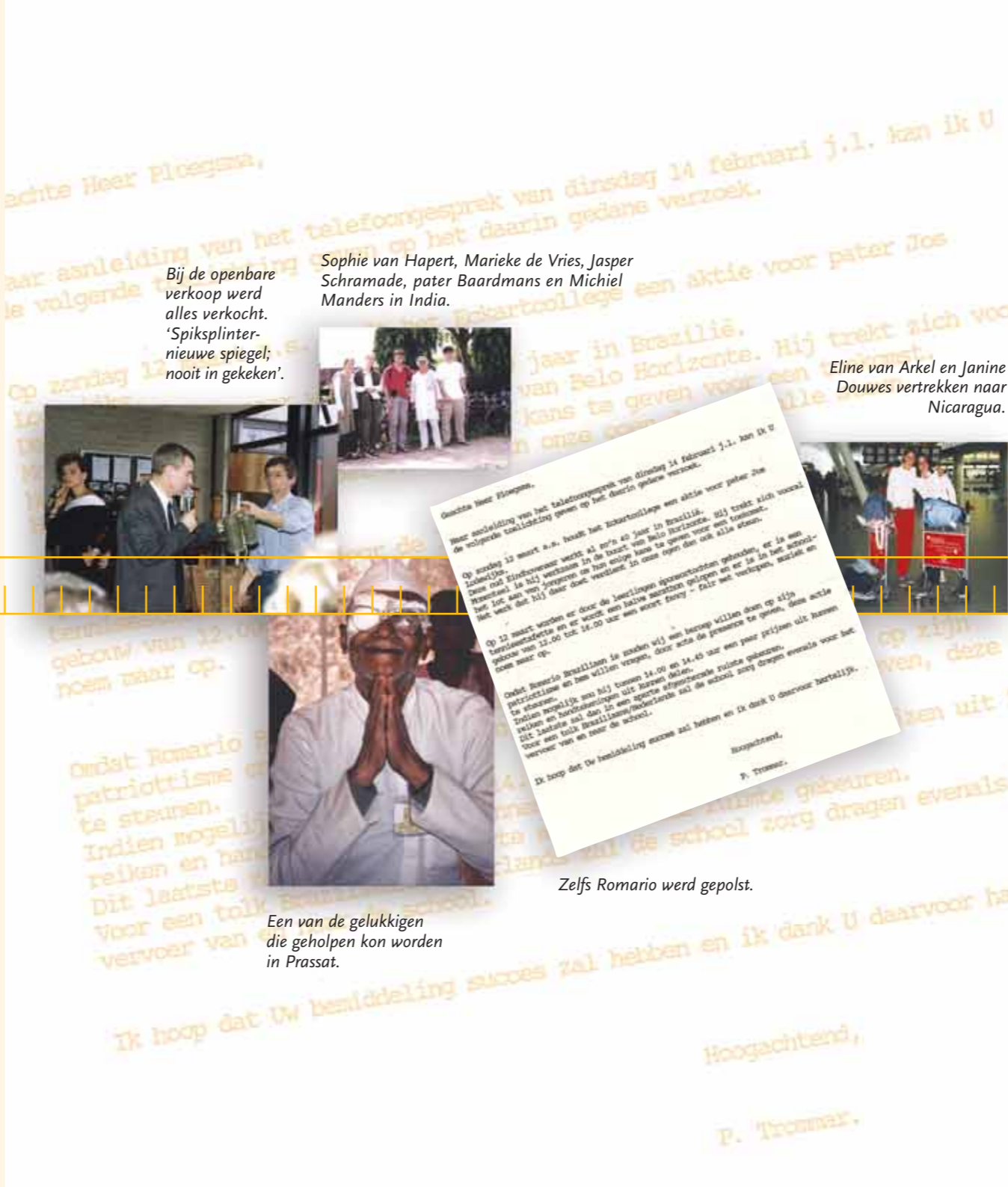
Bij de openbare verkoop werd alles verkocht. 'Spiksplinter-nieuwe spiegel; nooit in gekeken'.