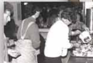
De ouders zorgen ervoor dat de honger gestild kan worden.